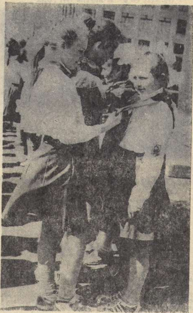
22 апреля у третьеклассников Новичихинской средней школы расцвели на груди красные галстуки. Теперь они полноправные члены Союза пионерских организаций.

С этим галстуком смелее Ты отправишься в поход, С ним дружнее, веселее Дело трудное пойдет. Так храни же галстук этот Он тебе надежный друг. Он правдивым ясным светом Освещает все вокруг. С ним иди в далекий путь И его достоин будь!