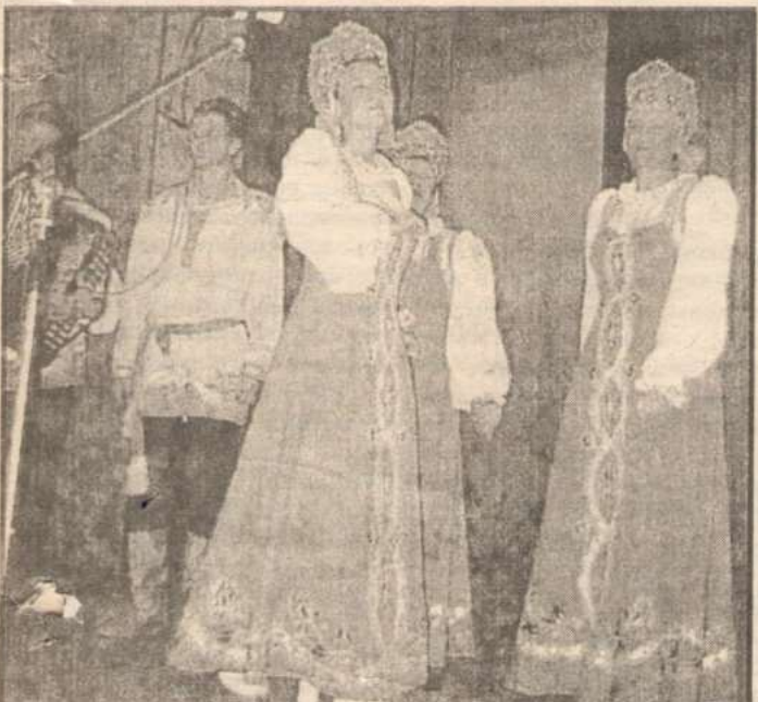
Педагогов поздравляют работники РДК.

она обучалось 2024 учащихся, закончили их 2000, или 98 процентов. 36 процентов ребят учатся на «4» и «5», осталось на второй год 24. Без второгодников закончили учебный год коллективы Солоновской, Октябрьской, Мамонтовской, Весело-Дубравской, Ильинской школ. Выше районной успеваемость в Мельниковской, Токаревской, Павловской школах.