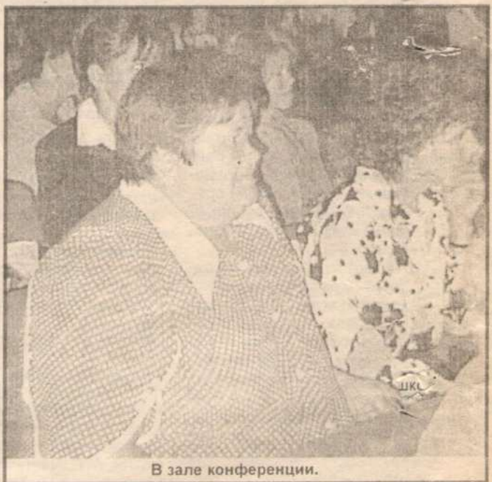
В зале конференции.

Спортивная работа пока в наших школах на должном уровне не ведется. И дело тут не в нежелании педагогов ее наладить. Не выдерживает никакой критики спортивная база школ. Администрация района в курсе того, что для проведения урока физкультуры у преподавателей