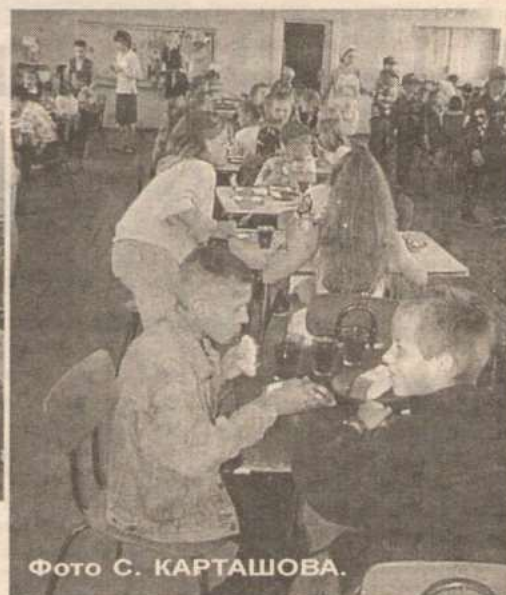
Фото С. КАРТАШОВА.