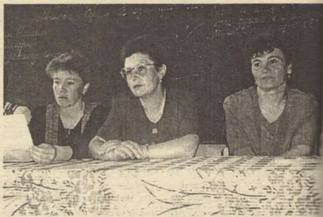
На снимках: во время выпускного экзамена в Новичинской средней школе.