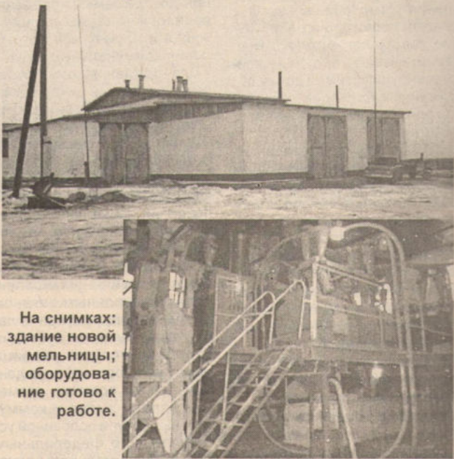
На снимках: здание новой мельницы; оборудование готово к работе.

Перерабатывающее производство решили выделить в отдельное дочернее предприятие. Оформили документы. Так родилось ООО «Радуга». Со штатом в 8 че-