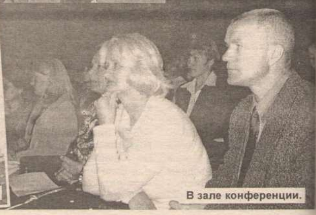
В зале конференции.

денцию их старения. Кроме этого, очевидно явное ухудшение материально-технической базы средних школ района.