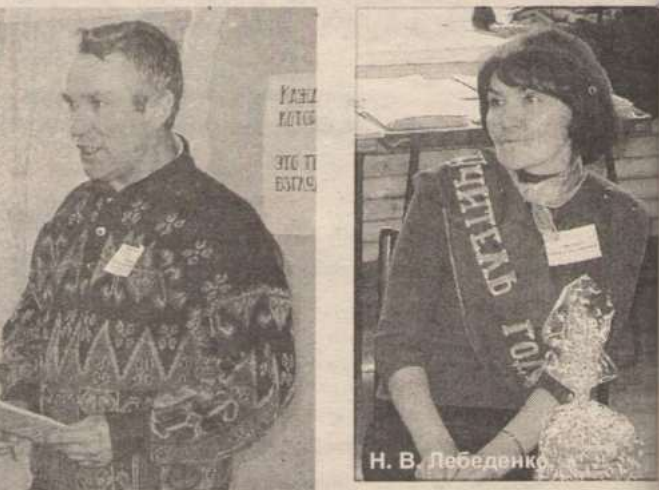
Н. В. Лебедевка.