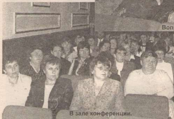
В зале конференции.