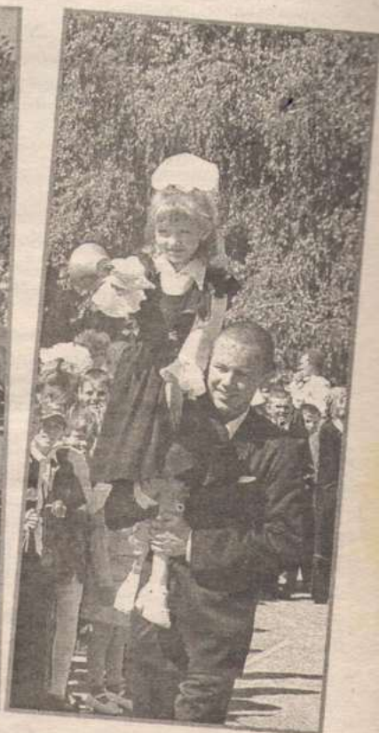
Для 53-х выпускников Новичихинской средней школы 25 мая прозвенел последний звонок.