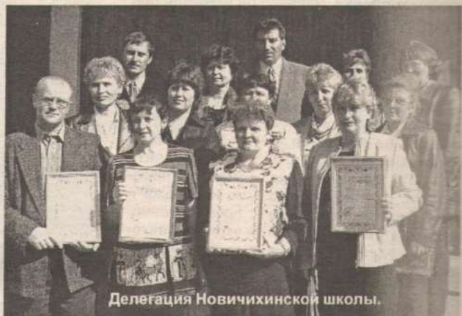
Делегация Новичихинской школы.

рая рассказала о работе классного руководителя.