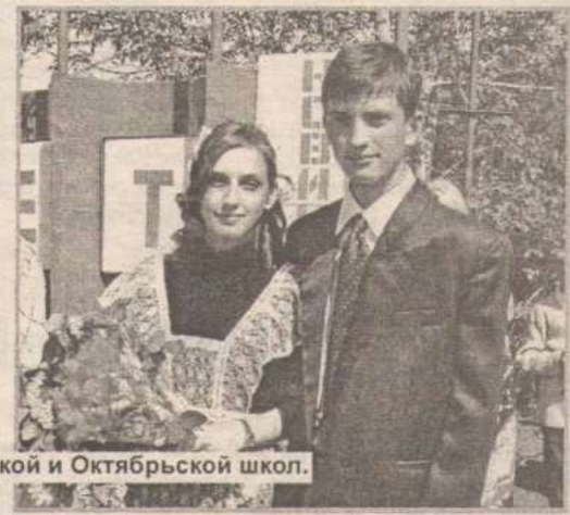
Снимки из Новичихинской и Октябрьской школ.

На торжественных линейках с напутственными словами выпускникам обратились директора школ, учителя и родители. В ответном слове ребята поблагодарили своих преподавателей и родителей, которые на протяжении школьных лет помогали им в нелегком учебном труде. В каждом селе на последнем звонке присутствовали представители районной администрации и комитета по образованию.