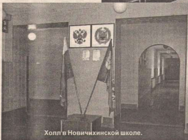
Холл в Новичихинской школе.