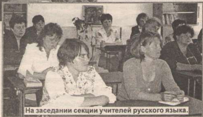
На заседании секции учителей русского языка.

Сокращение классов приводит к большому совместительству, когда учителей доружают различными предме-