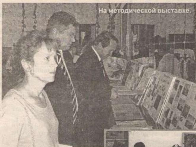
На методической выставке.

— Проблемы, возникающие в нем, становятся основным препятствием формирования сбалансированного бюджета,