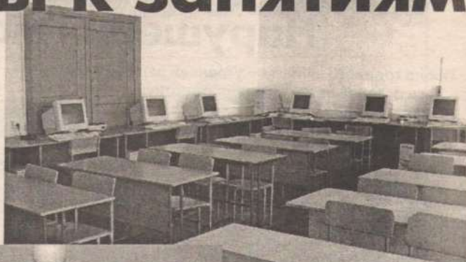
Компьютерный класс НСШ.

В перспективе администрация школы планирует сокращать площади в целях экономии. Вопрос решится только тогда, когда прояснится ситуация с деньгами.