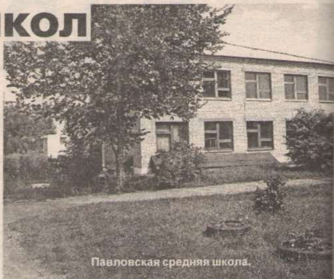
Павловская средняя школа.

Сегодня можно с уверенностью сказать, что школа готова к началу нового