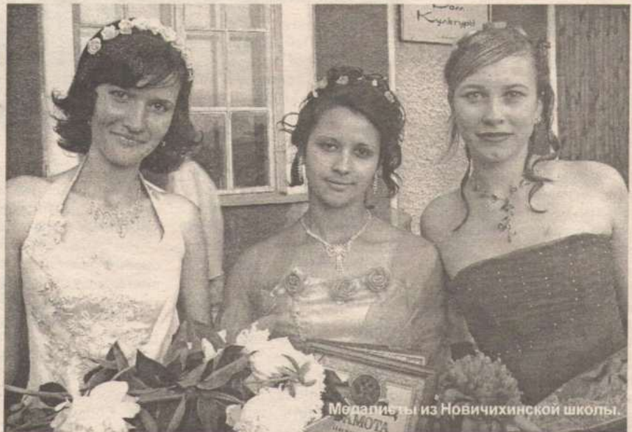
Медальеры из Новичихинской школы.