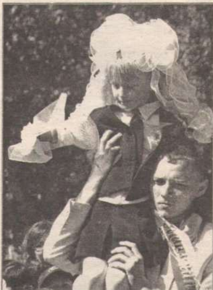
Последний звонок в Новичихинской школе.