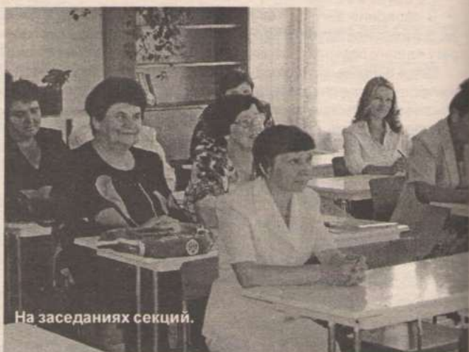
На заседаниях секций.