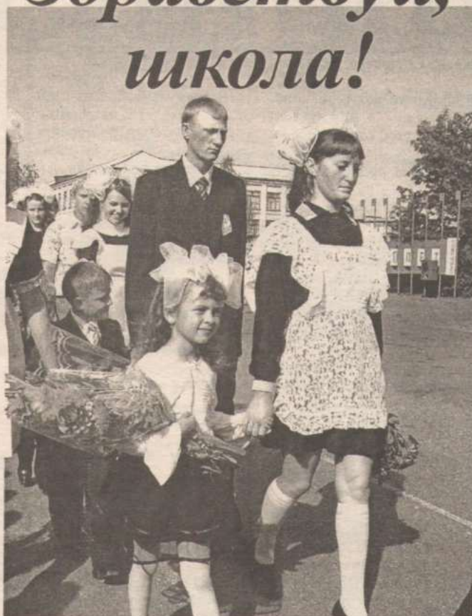
Линейка в Новичихинской средней школе.