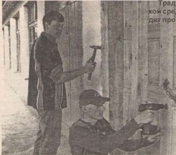
Традиционно десятиклассники Новичихинской средней школы в первый месяц лета проходят производственную практику.