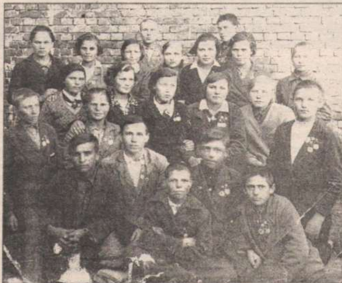
Лучший класс в 1939-1940 учебном году.