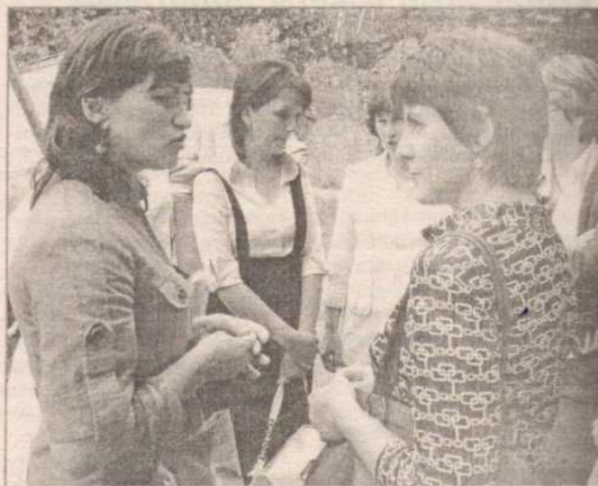
И во время перерыва есть о чем поговорить.

– В районе 712 детей от 1,5 до 7 лет. Охват дошкольным образованием составляет 54,9%. Наиболее востребованный возраст по обеспечению детскими садами от 1,5 до 3 лет. На сегодняшний день подано 105 заявлений в ДООУ (из них от 1,5-3 лет – 62 заявления). Сегодня вопрос увеличения количества мест в