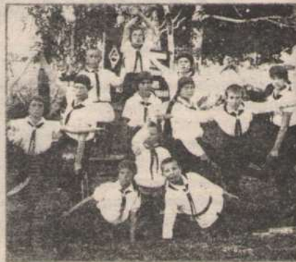
6-й класс. 1936 год.