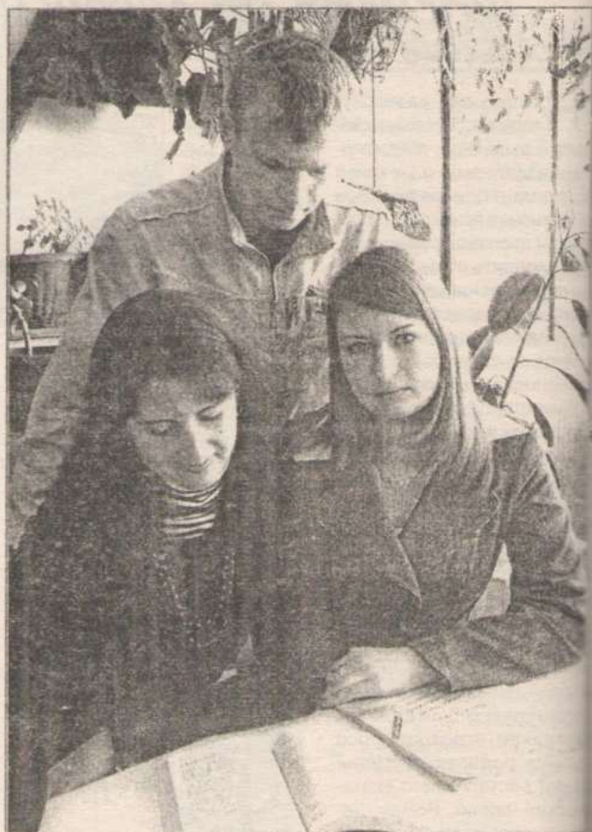
Скоро выпускников ждут серьезные испытания – ЕГЭ.

В свидетельстве о ЕГЭ выставляются «положительные» результаты по обязательным предметам (русскому языку и математике), а