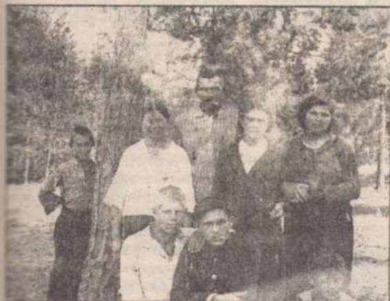
Вожатые пионерского лагеря. 1940 год.

же писал анонимные письма в редакцию местной газеты, содержащие клевету на органы советской власти.