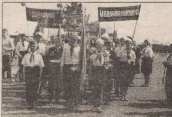
Пионерский слет в 1959 году.

Летом 1954 года в школу привезено из Камня-на-Оби и смонтировано оборудование для водяного отопления. Работа-