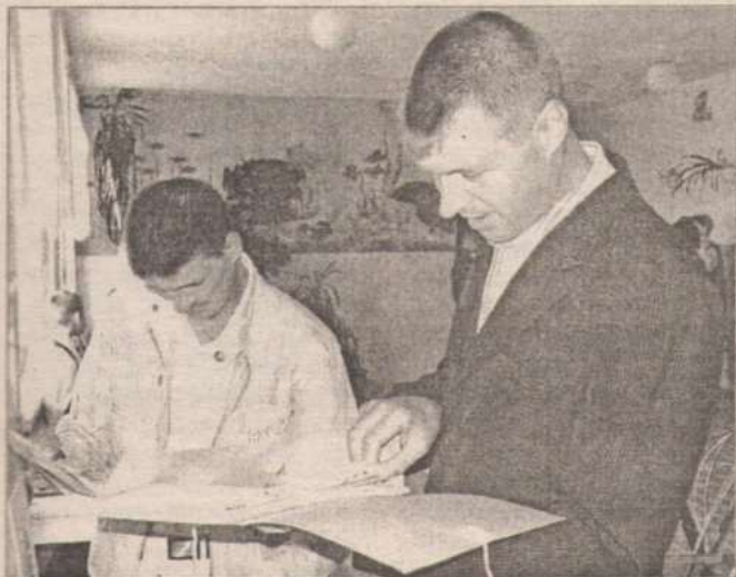
Выпускники знакомятся с материалами музея школы.

От имени ветеранов педагогического труда Б. ПОЧАТКОВА.