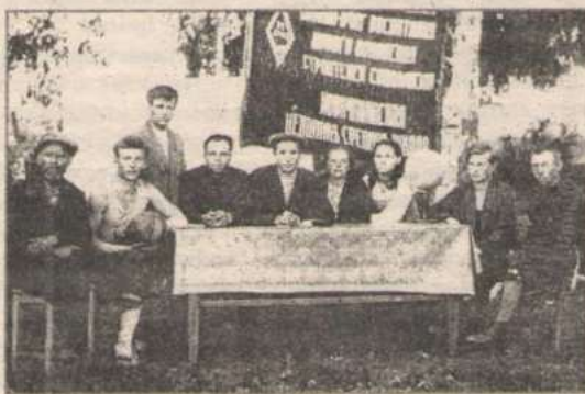
Учителя Новичихинской неполной школы. 1934-1935 гг.