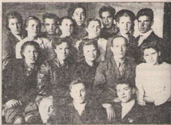
Выпускники 1947-1948 года.

Всероссийский комплекс «Готов к труду и обороне СССР» являлся основой физического воспитания трудящихся масс, а подготовка значкистов по комплексу — основной показатель работы образовательных учреждений в деле физического воспитания учащихся. В мае 1948 года в