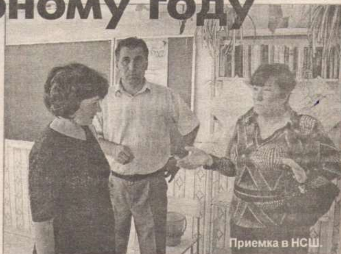
Приемка в НСШ.

С 17 по 20 августа прошла приемка общеобразовательных учреждений района к новому учебному году. Девять школ 1 сентября откроют свои двери для учеников, которых ждут чистые классы, современная техника и новое столовое оборудование.