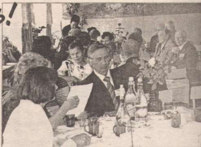
Работает педагогическая гостиная для ветеранов.