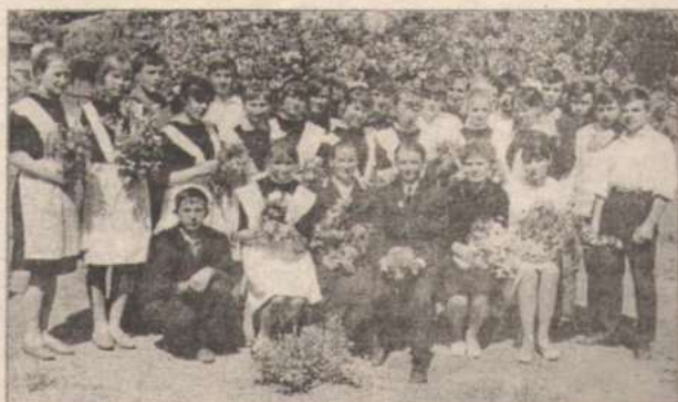
Выпускники 1968 года

В 1966 году 23 съезд КПСС поставил задачу перехода к обязательному полному среднему образованию.