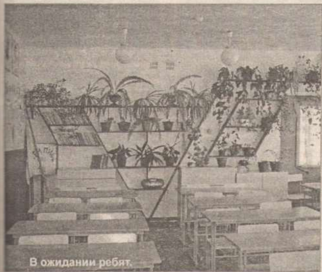
В ожидании ребят.