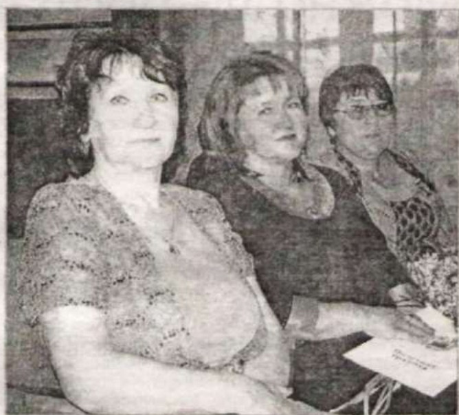
Коллектив Солоновской СОШ.

садах. Еще недавно мы со страхом ожидали мая, когда начнет работать комиссия по распределению мест, потому что как «по живому резали», отказывая какому-то ребенку в путевке. Сегодня у нас есть свободные места, мы готовы принимать детей не только в детские сады, но и в группы, которые открылись на базе сельских школ.