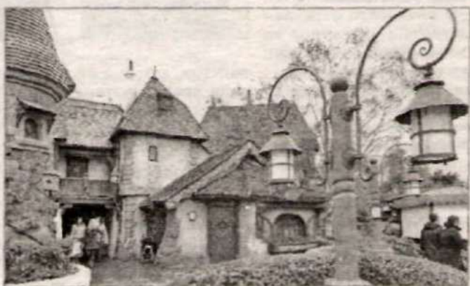
Сказочные замки Диснейленда.

метров, обнесенная колючей проволокой и протяженностью в сто шестьдесят километров, была не просто границей между двумя частями немецкой державы, за одну ночь она разделила тысячи семей почти на тридцать лет. Сегодня экскурсионные группы с удовольствием фото-