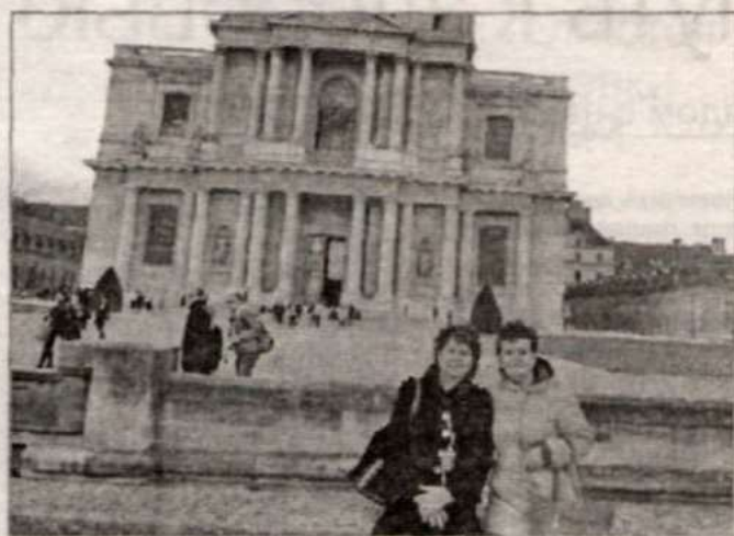
Париж. У Дома инвалидов (гробница Наполеона).

Берлинская стена также пользуется популярностью у приезжих. В свое время ограда высотой более трех