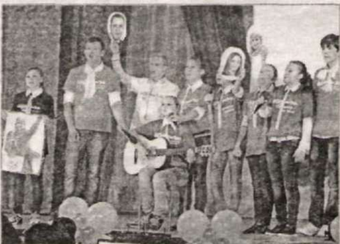
На сцене – «Импульс» из Угловской СОШ.