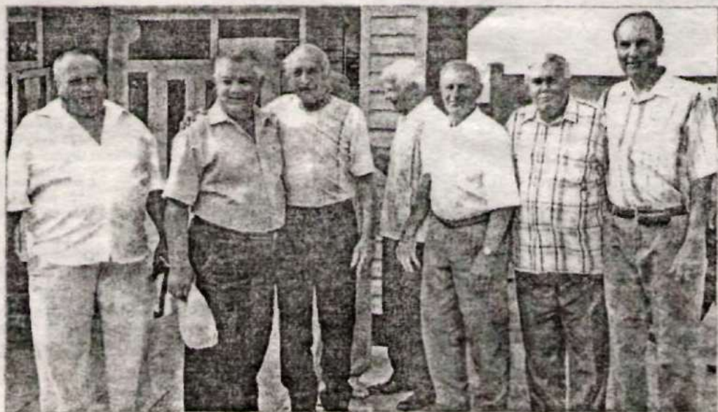
На пороге школы – через 50 лет после выпуска.

Очередной выпускной вечер в Новичинской СОШ был особенный – 75-й. Двери для гостей были распахнуты в течение дня. Люди, среди которых многие приехали издалека, прошли по обновленной школе, повстречались педагогами и одноклассниками. Это были приятные встречи: с разговорами, воспоминаниями.