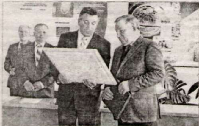
В подарок – картина местного художника.

Подготовила Алена ГОРЯЧИХ.