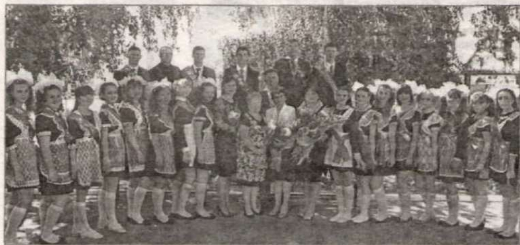
Выпускники НСШ на празднике Последнего звонка.

«Всего вам самого доброго, пусть жизненный путь будет гладким. Возвращайтесь после учебы в родные места. Району нужны ваши