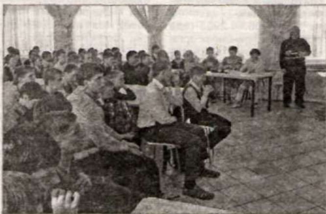
На презентации в НСШ.