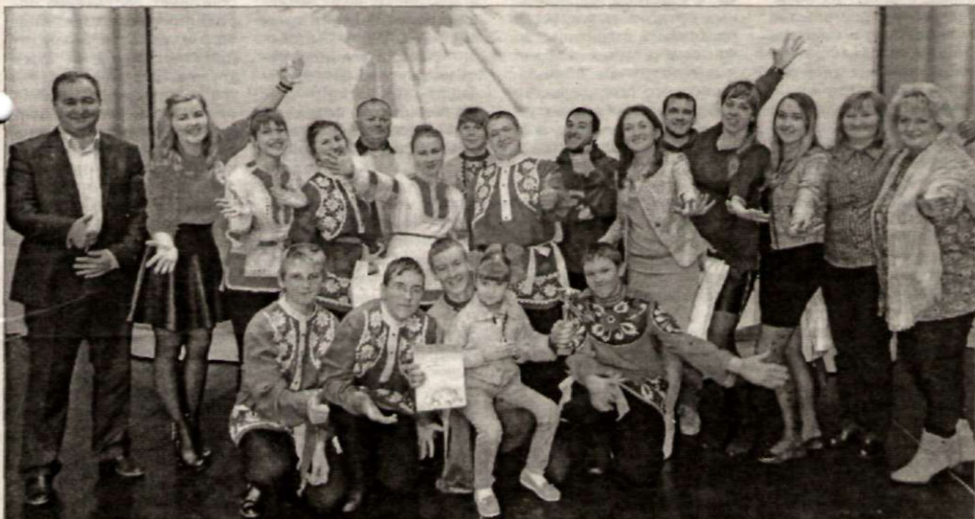
Победители из Новичихинской СОШ и организаторы «Школьного капустника».