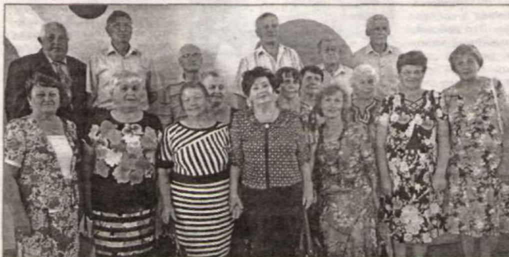
Встреча через пятьдесят лет после окончания школы.

Уже с рассветом для вчерашних школяров закончилось детство. А пока до этой минуты – целая ночь. Та самая, которая запоминается потом на всю жизнь.