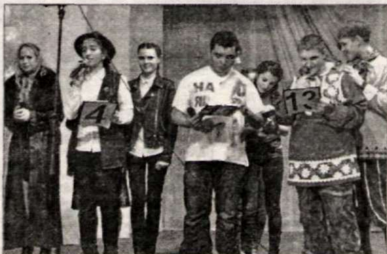
На школьном капустнике.

Все команды получили дипломы участников. Те же, кто отличился, а это, помимо наших земляков, зо-