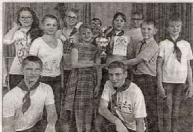
Победители – команда «Семицветик».

На завершающем этапе участники защитили социально значимые акции (проекты). Все команды ответственно подошли к выполнению данного задания. Особенно членов жюри поразил проект волонтерского отряда «Радуга добра» из Павловской школы, который состоял из двух частей: акций «Забота» – поддержка и участие в жизни ветеранов и пожи-