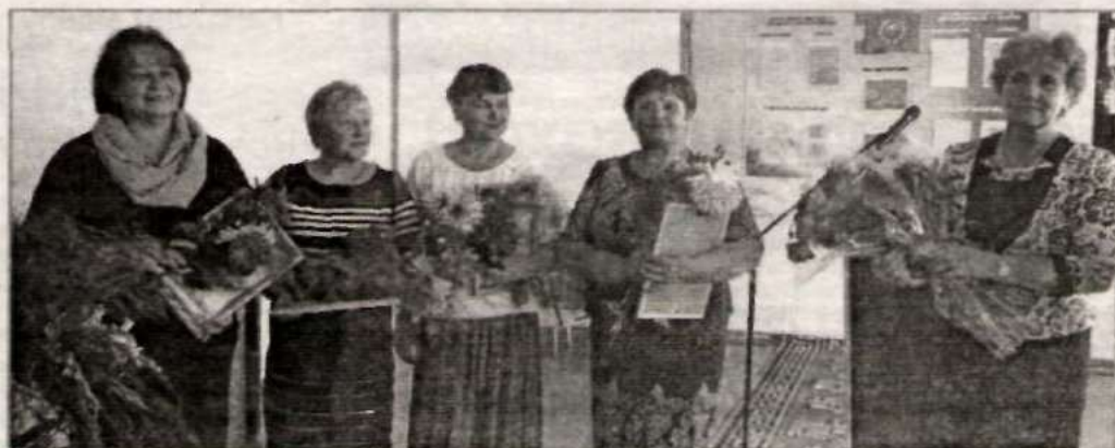
Ветераны педагогического труда.

Ведется работа по сокращению документооборота, в том числе с использованием информацион-