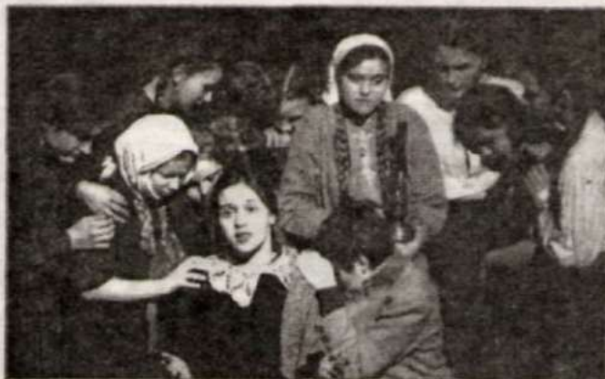
Фрагмент спектакля «Война глазами детей».

– Нам удалось побывать на удивительном меропри-