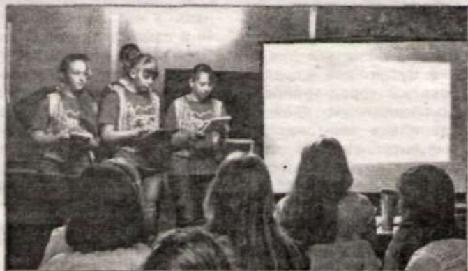
С презентацией выступают учащиеся НСШ.