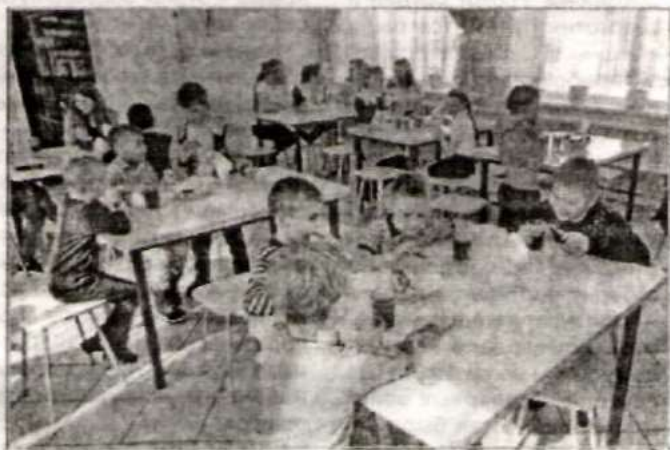
В столовой Новичихинской СОШ.