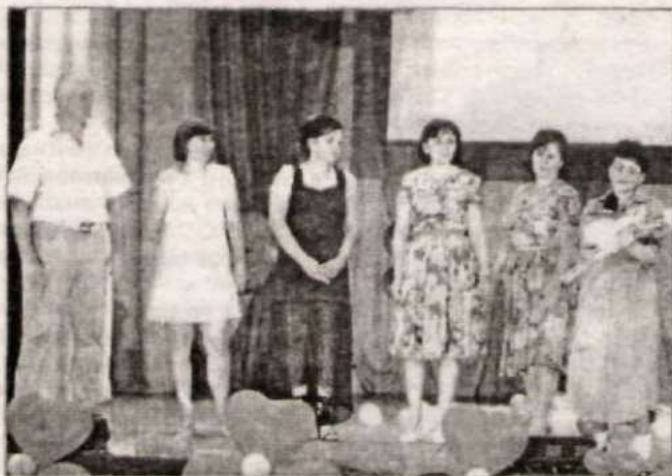
Зачитывается письмо из далекого 1988 года.