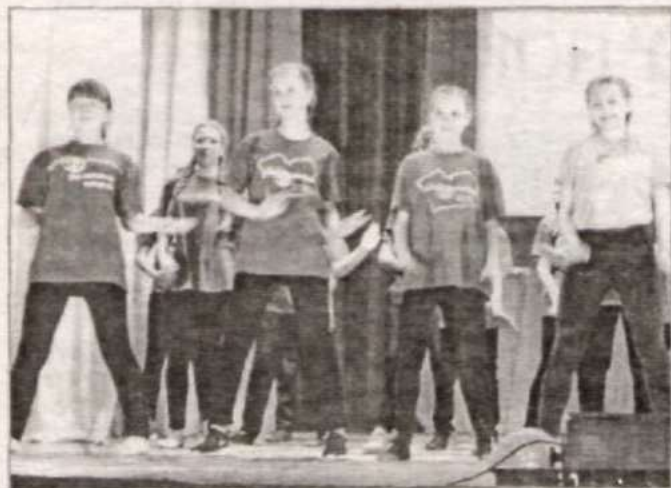
На сцене – новичихинцы.

Напоследок организаторы оставили самое серьезное задание. Необходимо было защитить социально значимую акцию или проект. Какие только задумки не реализованы отрядов-