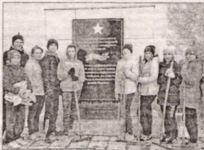
Волонтеры у памятника павшим героям ВОВ.

В ходе Всероссийской патриотической акции «Свеча памяти», которая традиционно проходит во всех регионах страны 22 июня, активисты общественного движения напоминали односельчанам о