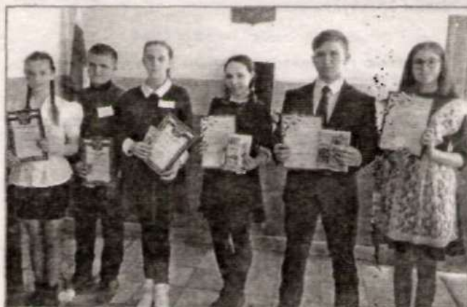
Участники из Мельниково и Лобанихи.