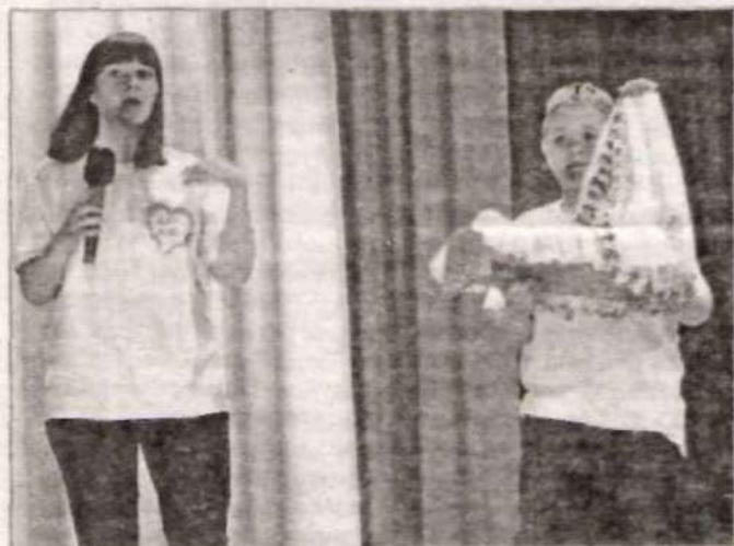
Детская кроватка от волонтеров из Долгово.