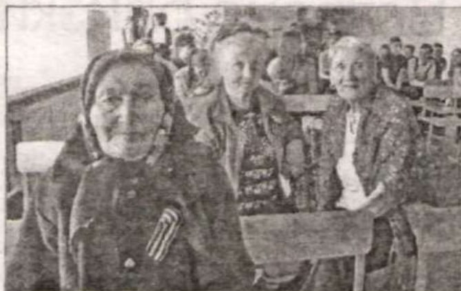
Почетные гости мероприятия.

– Сегодня даже вспомнить страшно, как мы мог-