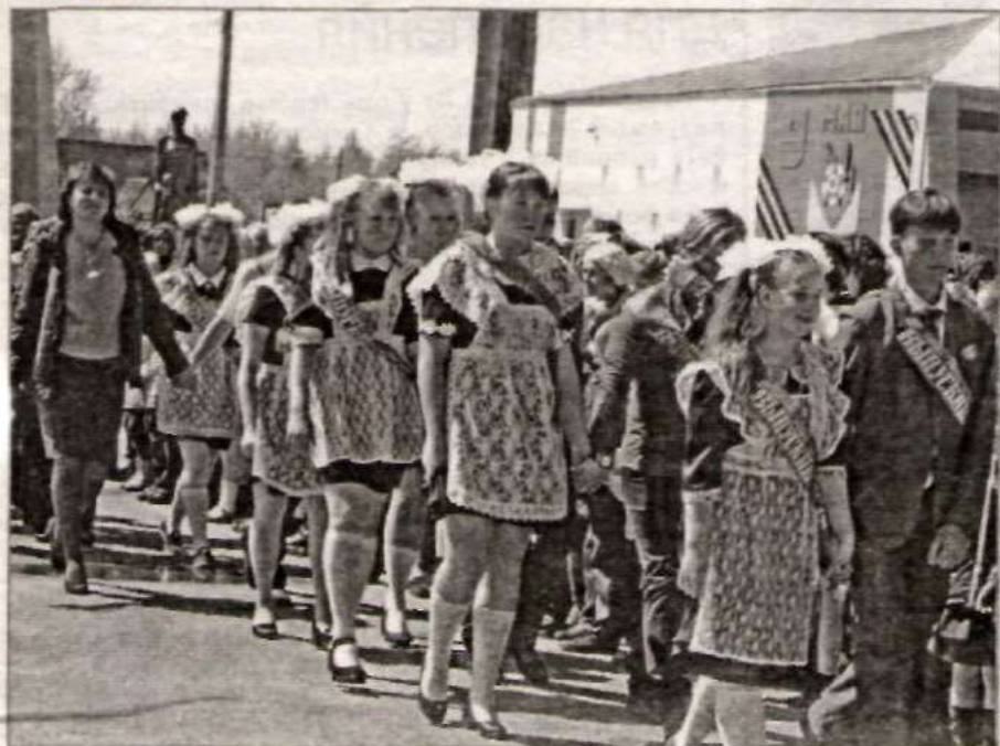
Торжественная линейка в НСШ.