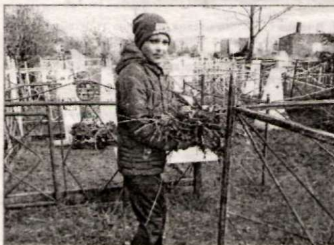
На уборке территории сельского погоста.

Кстати, звание волонтера, в первую очередь, отражает внутренние качества