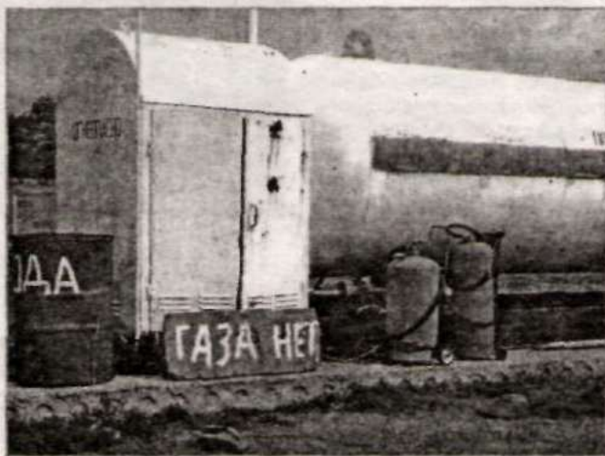
Судьба газовой заправки в Новичихе пока под вопросом.

– Волноваться по поводу доставки газовых баллонов не стоит. Она продолжится. Развозка будет из Шипуново по графику, без перебоев, по единой цене,