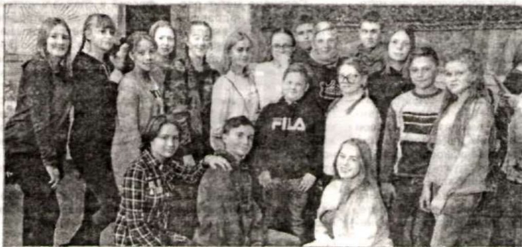
Новичихинская команда «B1».