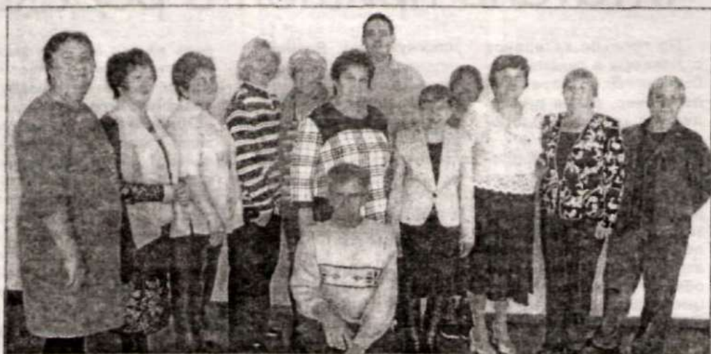
Участники курсов компьютерной грамотности.

– Программа рассчитана на обучение продолжительностью 28 академических часов. За это время мои подопечные многого достигли. Теперь у них есть электронная почта, они свободно печатают текст и могут общаться в скайпе.