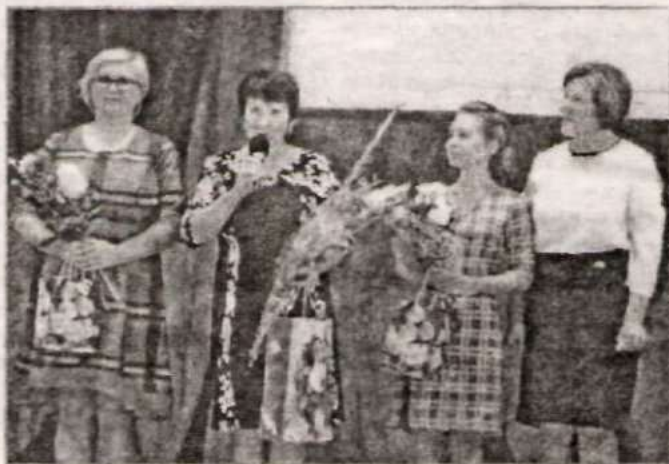
Слова напутствий молодым специалистам.

вания является итоговая аттестация выпускников 9 и 11 классов.