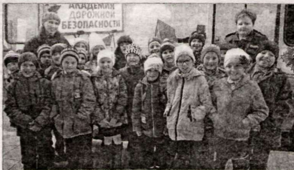
«Академия дорожной безопасности» в гостях у школьников.

Проведение профилактических мероприятий сопровождалось показом видеороликов и тематических мультфильмов. Юрисконсульт правового направления МО МВД России «По-