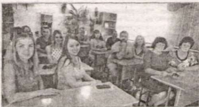
Выпускники 2008 года снова рядом с учителями.