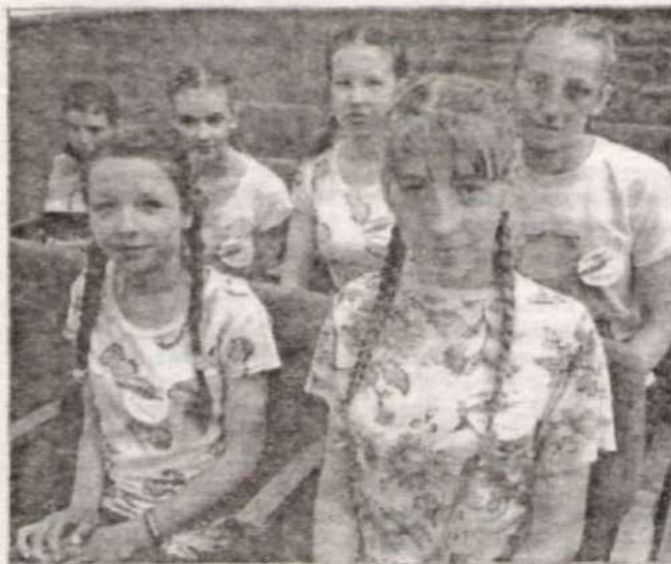
Команда из Токарево.