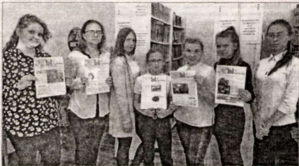
Корреспондентский состав школьной газеты «Наша История».

Все те, кто приступает к новому делу и кто уже постиг азы творчества, реша-