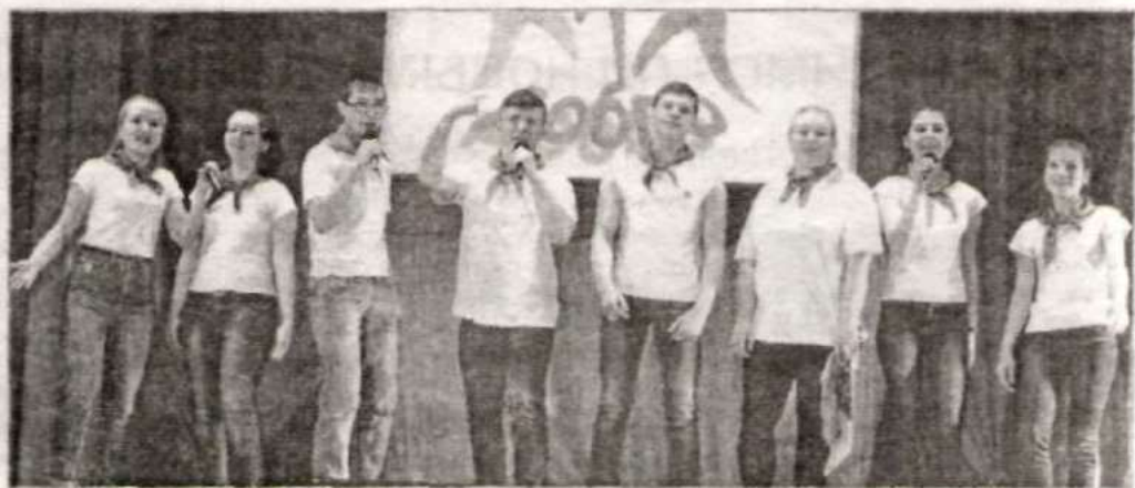
На сцене – мельниковцы.