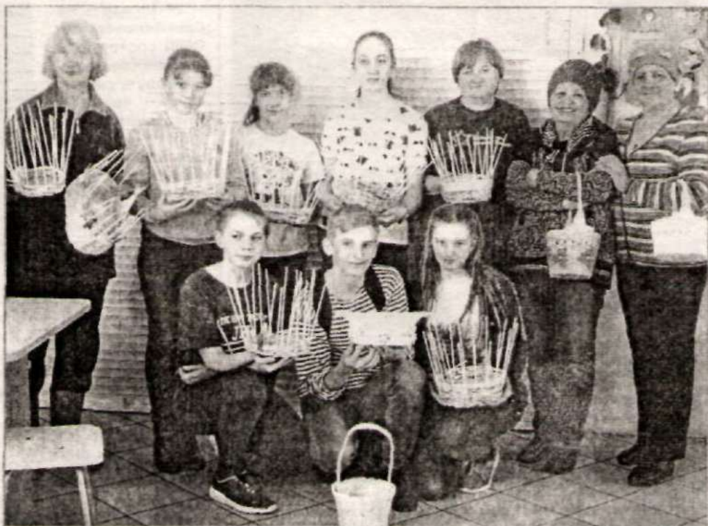
Участники мероприятия с поделками.

дано не просто уметь что-то сделать самому, но и объяснить, доступно рассказать другим все тонкости работы. А этим женщинам годы не только не мешают, а, наоборот, помогают бескорыстно делиться с другими своим опытом, мудростью и знаниями. Вот такие они, наши серебряные волонтеры!