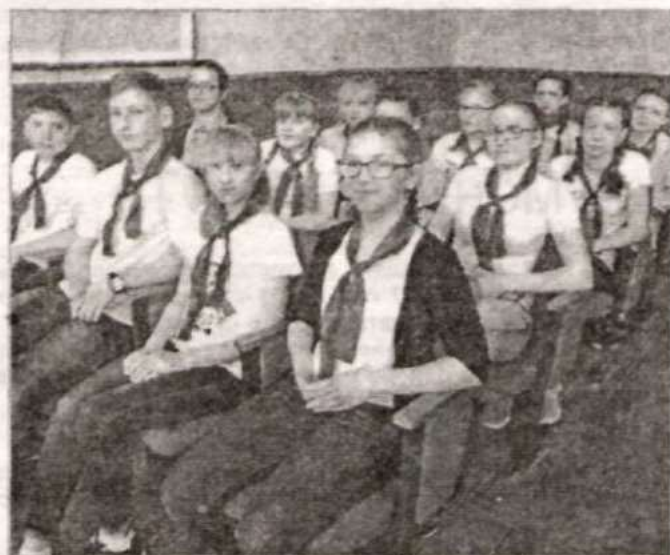
Волонтеры из Поломошного.