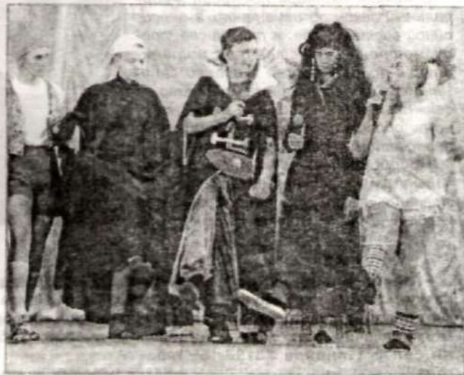
Во время игры.