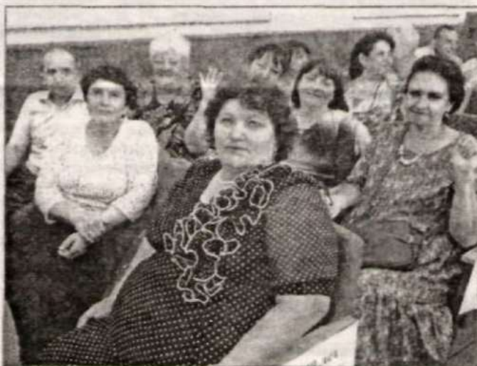
Выпускники 1978 года.