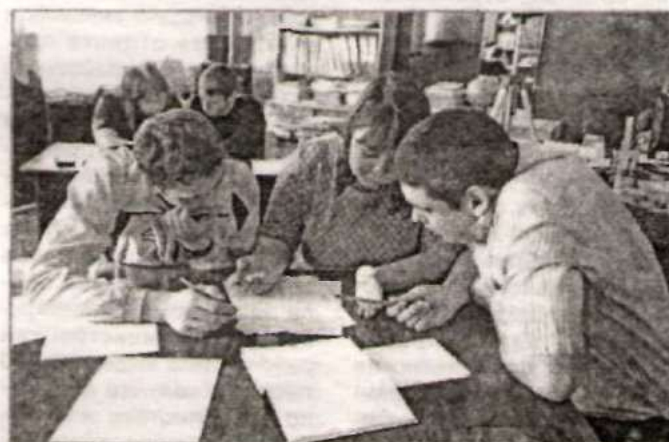
Во время выполнения практического задания.

Клуб молодого учителя действует в районе с 2012 года, а нынче это уже второе заседание.