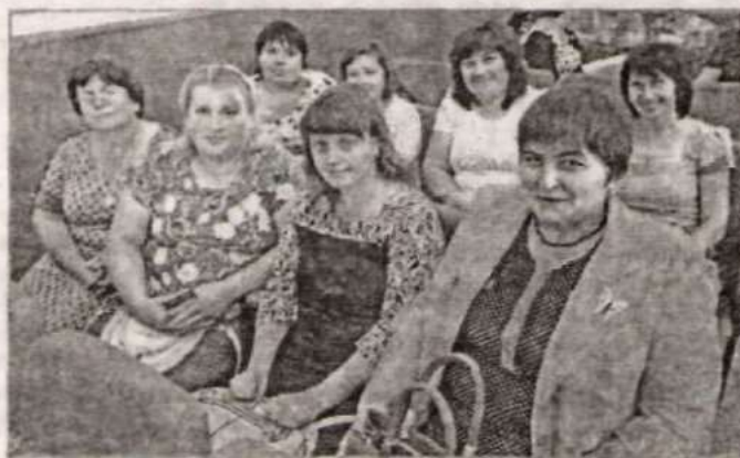
Педагоги из Долгово.

Одним из ведущих показателей качества образо-