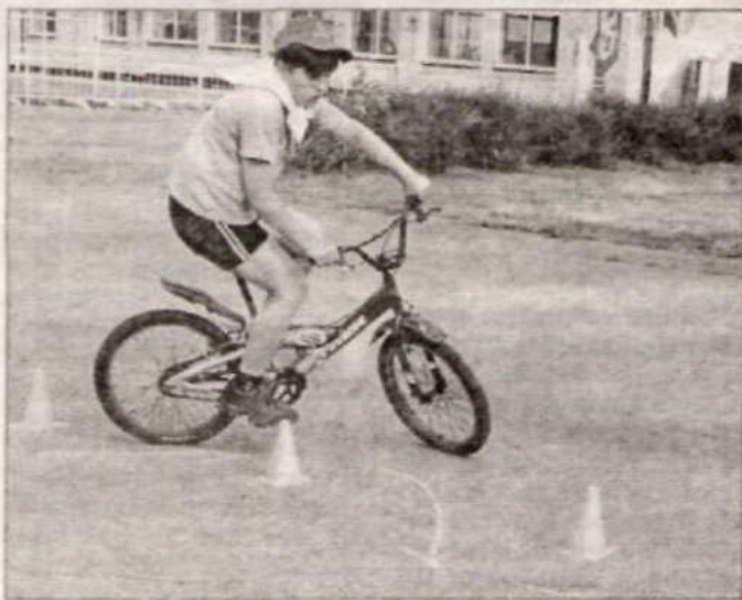
На дистанции представитель из Мельниково.