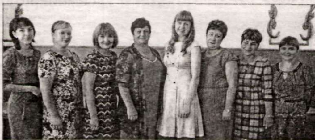
Делегация Токаревской школы.

Один из важных элементов укрепления здоровья – летний отдых . Традиционной его формой являются пришкольные детские оздоровительные лагеря с дневным пребыванием. В 2018 году такой лагерь был открыт в Солоновской школе, где оздоровлено 40 детей. Краткосрочные профильные лагеря, создан-