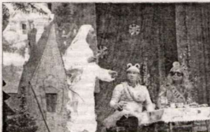
Артисты из ООО «Новичиха лес».