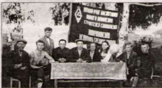
Учителя Новичихинской полно-средней школы, (1934-1935 гг.).