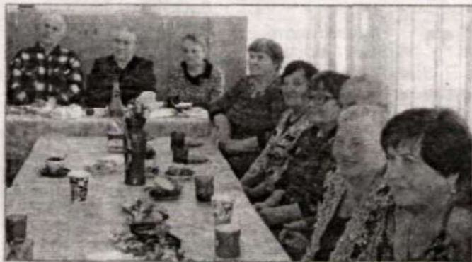
Во время чаепития.