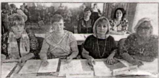
Мандатная и редакционная комиссии за работой.