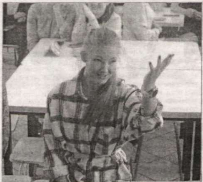
«Поступайте именно в наше учебное заведение», – так говорили ребятам все представители алтайских вузов.