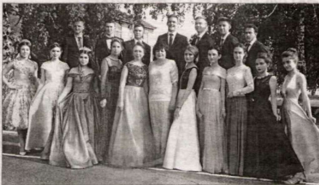
Виновники торжества. Фото на память.

Как с надеждами на хороший улов уходят из гавани корабли, так и в поисках своей мечты по бурному морю жизни уезжают из дома выпускники. А на родных берегах их остаются ждать самые близкие люди, которые верят, что у начинающих «мореплавателей» всё получится. Не зря окончание школы сравнивается с дальним плаванием – неизведанным, волнующим, полным приключений, но в то же время самым серьезным и ответственным.