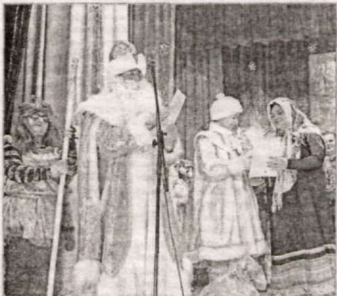
Диплом получает ЦРБ.