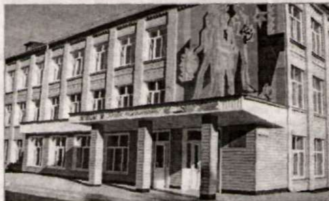
Новичихинская средняя школа.