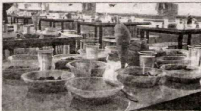
Участников ждет вкусный обед.