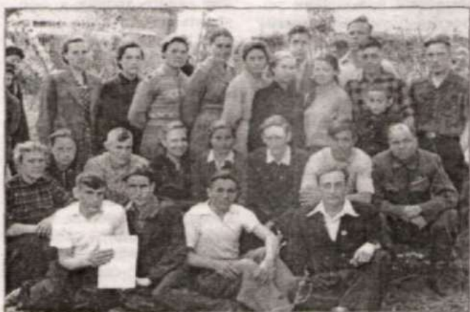
Выпускники 1960 года.