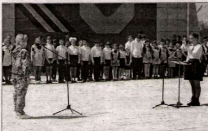
Церемония принятия присяги.