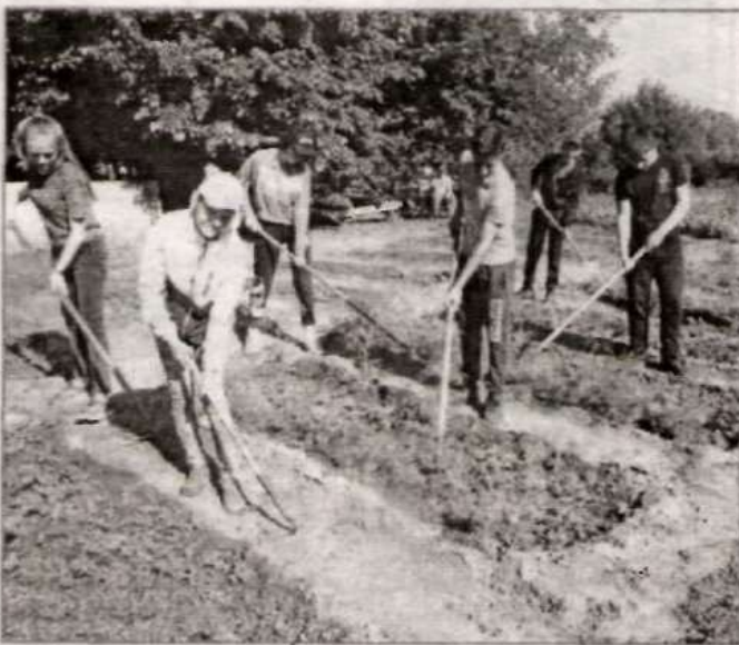
Новичихинские школьники на практике.

На календаре – июль. У школьников в разгаре каникулы – замечательное время отдыха. Но не все ребята спешат расстаться со школой. В ОУ района организована летняя трудовая практика.