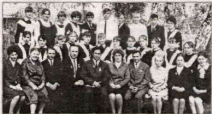
Выпускники 10 «б» класса 1970 года.