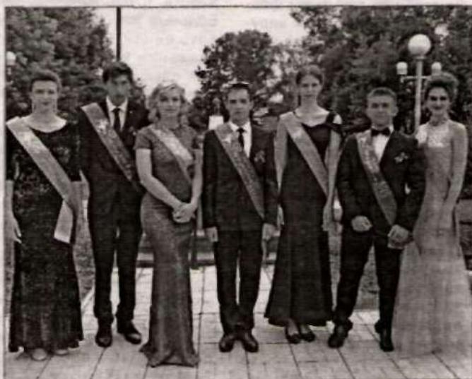
Выпускники Мельниковской СОШ.