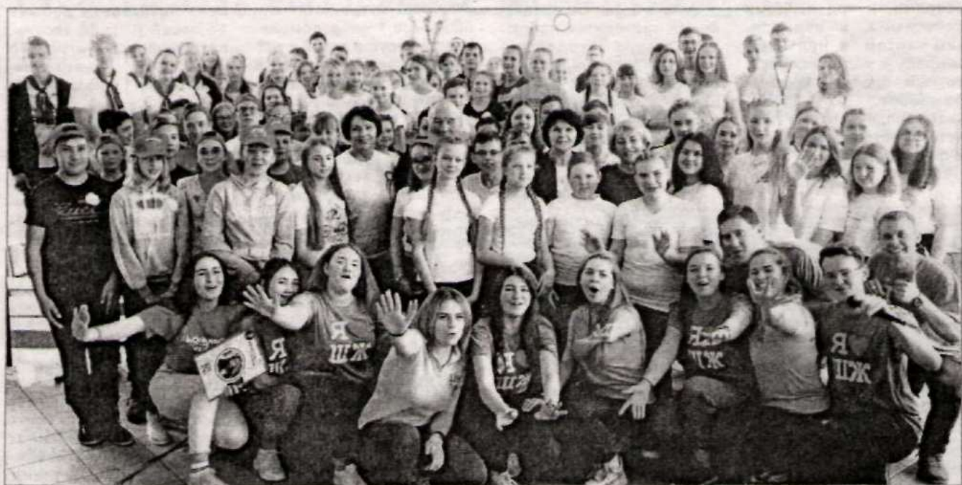
По традиции – фото на память.