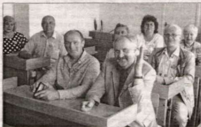
Классный час у выпускников 1979 года.