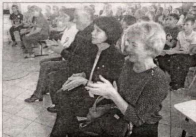
Почетные гости мероприятия.