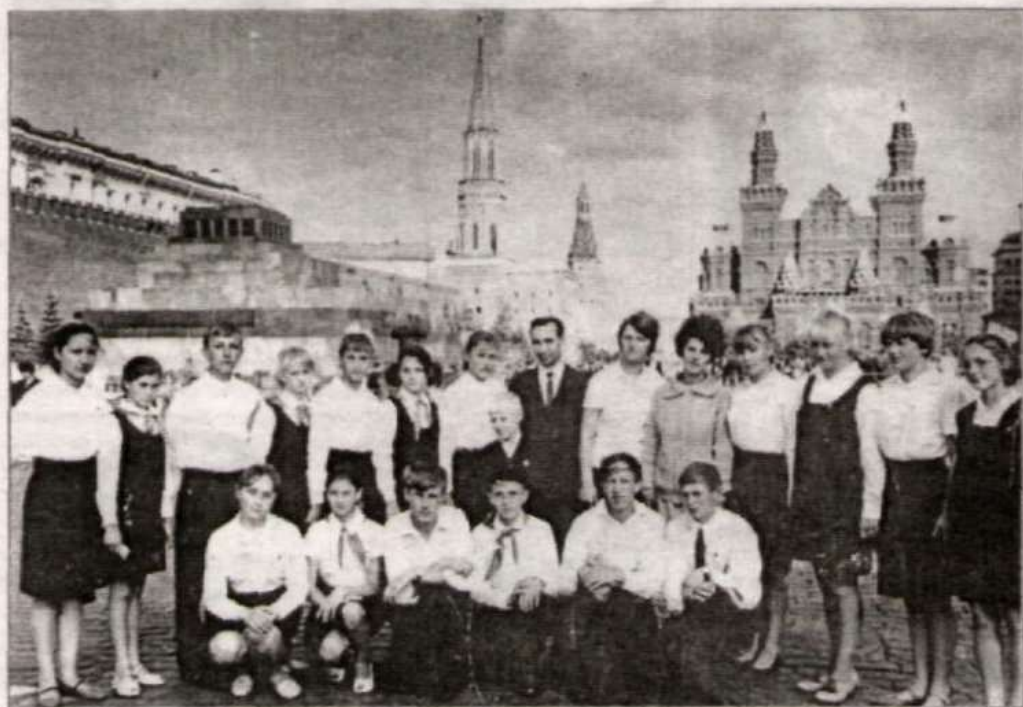
Учащиеся Новичихинской средней школы в Москве.