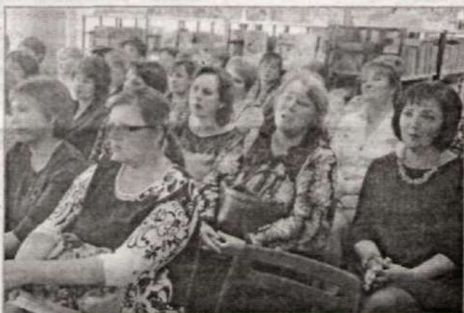
Зал был полон.