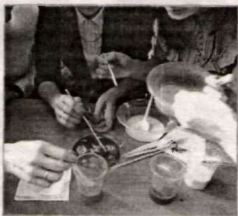
Задание для педагогов.

Отмечу отличную организацию встречи. Все поставленные цели участниками были достигнуты, а намеченный план выполнен. В секции, куда меня распределили, было 26 человек, с некоторыми теперь поддерживаю связь, общаюсь. Благодаря Ассо-