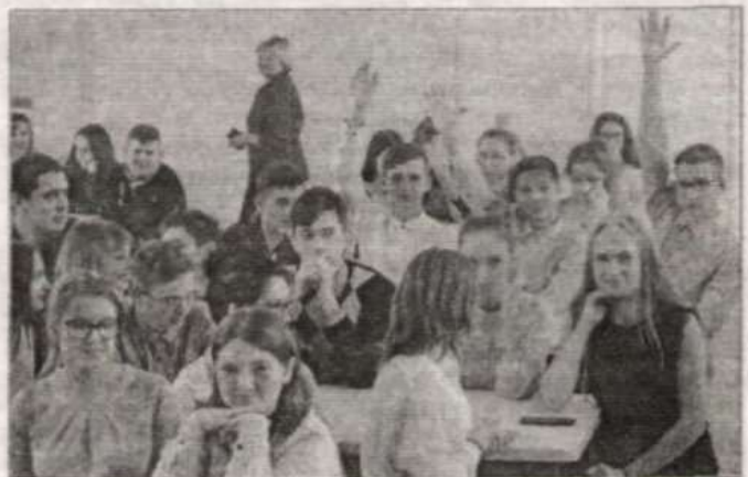
Мы уверены в своих знаниях.