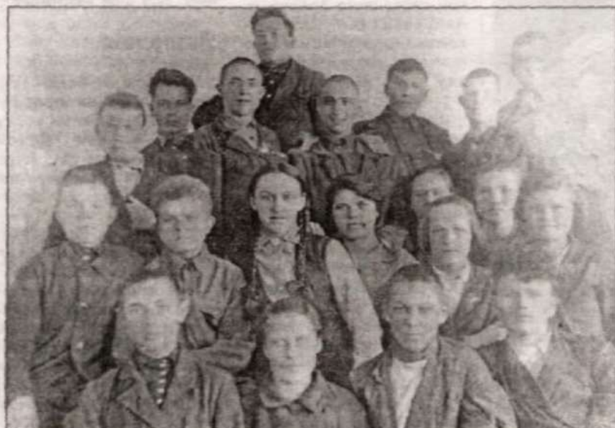
10 класс. 1939-1940 гг.