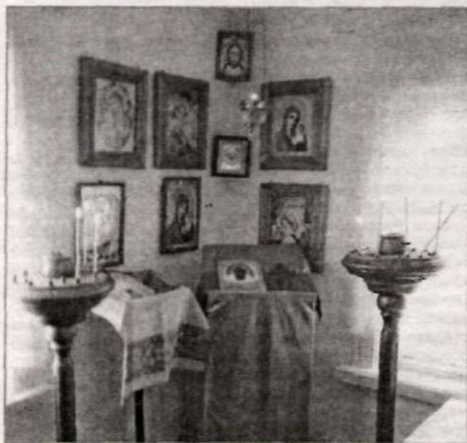
В молеальном доме.

Один раз в неделю мы встречаемся для молитвы, много интересного о право-