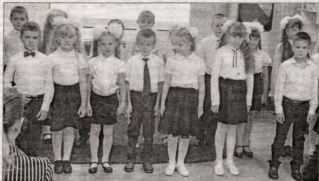
Выступает младший хор ДМШ.