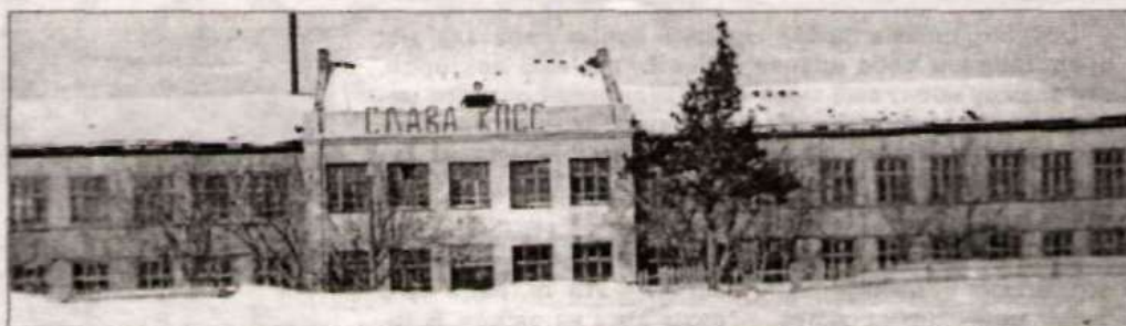
Новичихинская средняя школа построена в 1937 году.