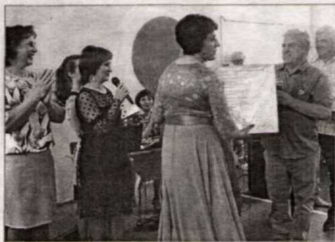
Подарок родной школе.