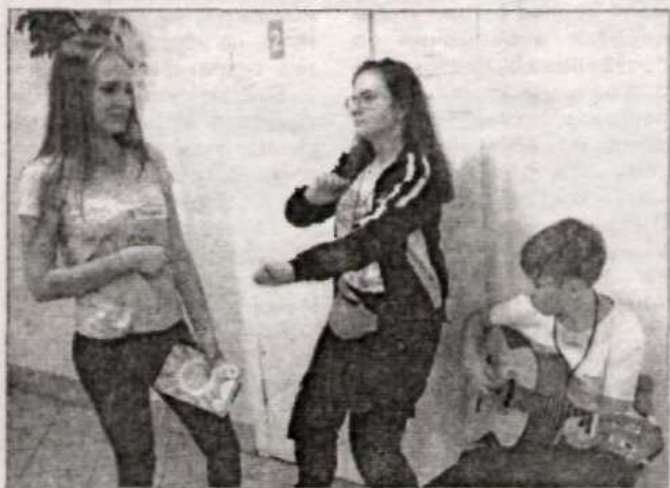
В перерывах – музыка и танцы.

О значимости мероприятия говорит тот факт, что каждый активист мечтает побывать на ней, ведь, по признанию самих ребят, – это замечательная возможность прокачать свои навыки, получить массу полезной и нужной информации, чтобы потом воплотить идеи на местах, познакомиться со сверстниками из других образовательных учреждений и просто весело провести время.