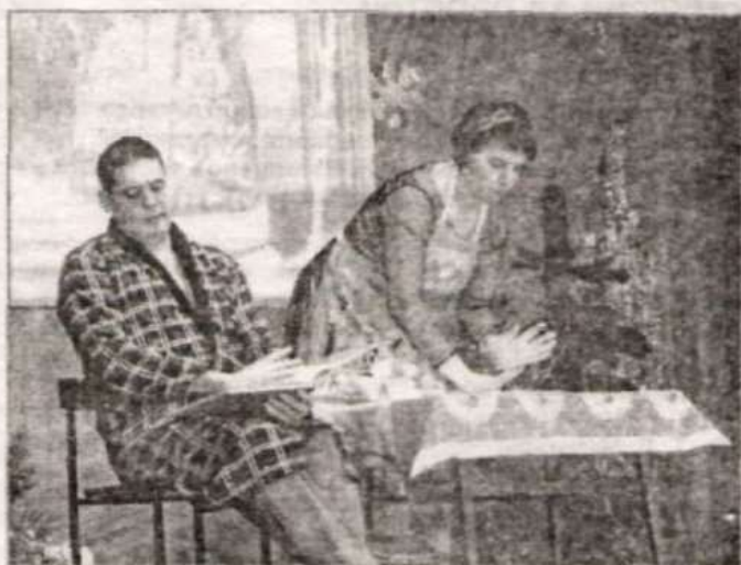
Сценка «Красная шапочка», НСШ.