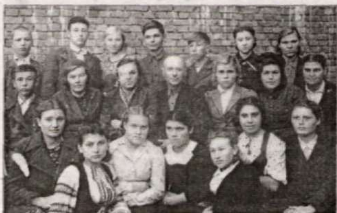
Первый выпуск в послевоенные годы (1945-1946 гг.).

В 1955 году ввели практикумы по электро- и сельхозтехнике, была организована работа подсобного хозяйства, а с 1957-го начала функционировать школьная производственная бригада. Здесь старшеклассники с удовольствием проходили сельскохозяйственную практику. Колхоз «Россия» выделил школе 165 га земли, три трактора, автомашину, инвентарь. Ребята на участке выращивали пшеницу, кукурузу, горох. В 60-е годы многие учащиеся получили права трактористов-машинистов 3 класса.