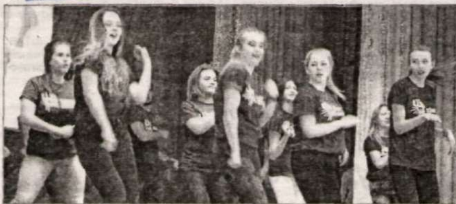
Флешмоб от наставников.

Издаётся с 23 февраля 1935 года. Питница, 18 января 2019 года №3 (9826)