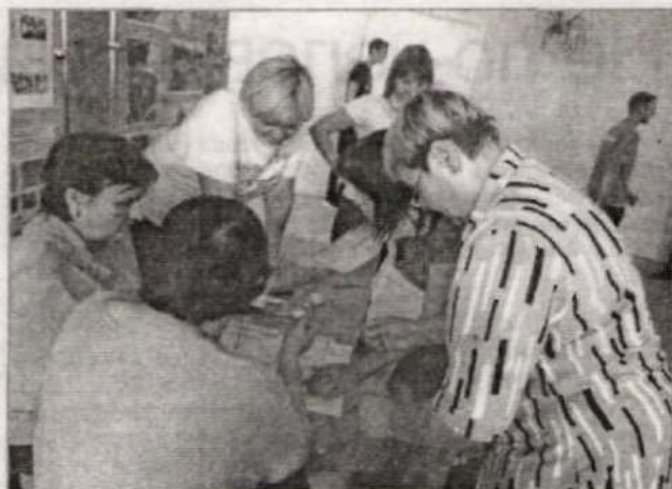
Педагоги тоже участвовали в конкурсах.

Подготовила Ольга ТРОФИМЧУК.