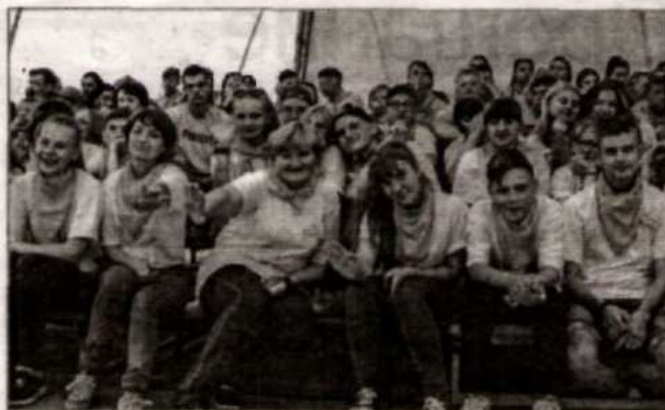
Участники «Школы Жизни».