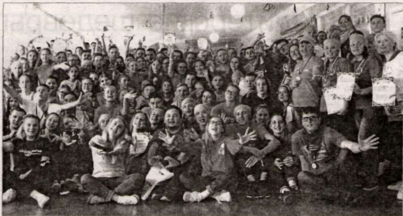
Школа Жизни. Фото на память.

Особая благодарность Новичихинской школе за гостеприимство. Все было на высшем уровне!