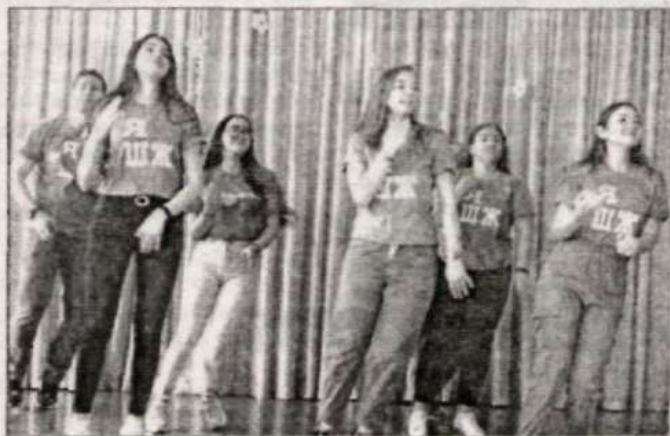
Флешмоб от наставников.