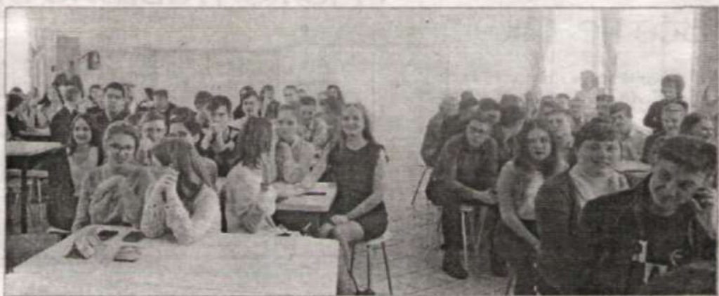
Школьники на лекции.

В конце ноября на базе Новичихинской средней школы прошло краевое профориентационное мероприятие «Строим будущее Алтая». Для учащихся 9-10 классов представители вузов рассказывали о профессиях, которые можно получить, поступив в технический, аграрный, медицинский, педагогический университеты, АГУ, институты экономики или индустриальный.