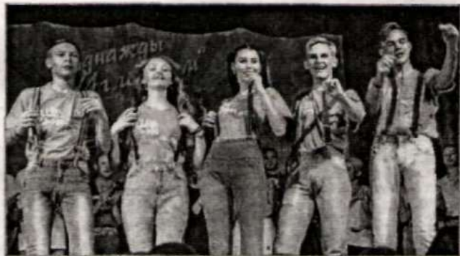
Команда «Ы» во время выступления.

30 ноября, в самый канун зимы, в с. Угловское прошел ежегодный школьный капустник «Однажды в Угловском» в рамках молодежного движения «Школа Жизни». В текущем году в нем приняли участие 11 команд – учащиеся 5-11 классов школ Славгорода, Угловского, Рубцовского, Волчихинского, Егорьевского, Новичихинского, Немецкого национального районов. Всего около 150 ребят.