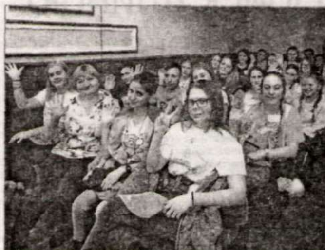
Делегация от нашего района.

– Школа Актива в Новичихе стала для меня чем-то особенным. Прежде всего, это моя малая родина. Во-вторых, на мероприятии было очень много нового как для мальчишек и девочек, так и для меня. И самое главное, мои подо-