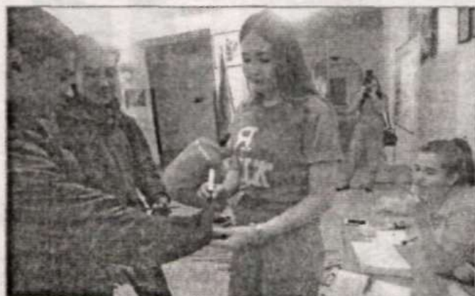
Идет регистрация участников.

1 ноября в Новичихинской СОШ, несмотря на то, что еще не закончились каникулы, с самого утра наблюдалось оживление, поскольку в течение дня здесь будет проходить выездная Школа Актива молодежного движения «Школа Жизни», участником которого на протяжении 7 лет является наш район.