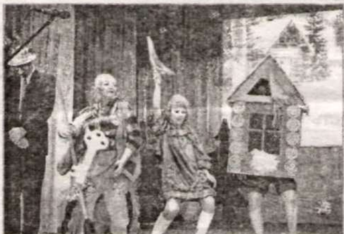
На сцене – комитет по образованию.