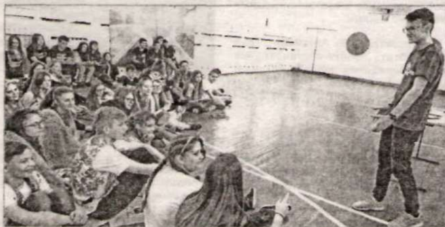
Во время мастер-класса.