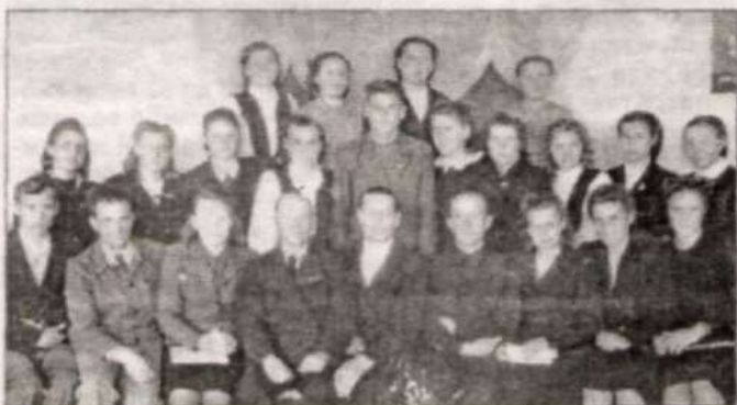
Выпускники 1950 года.